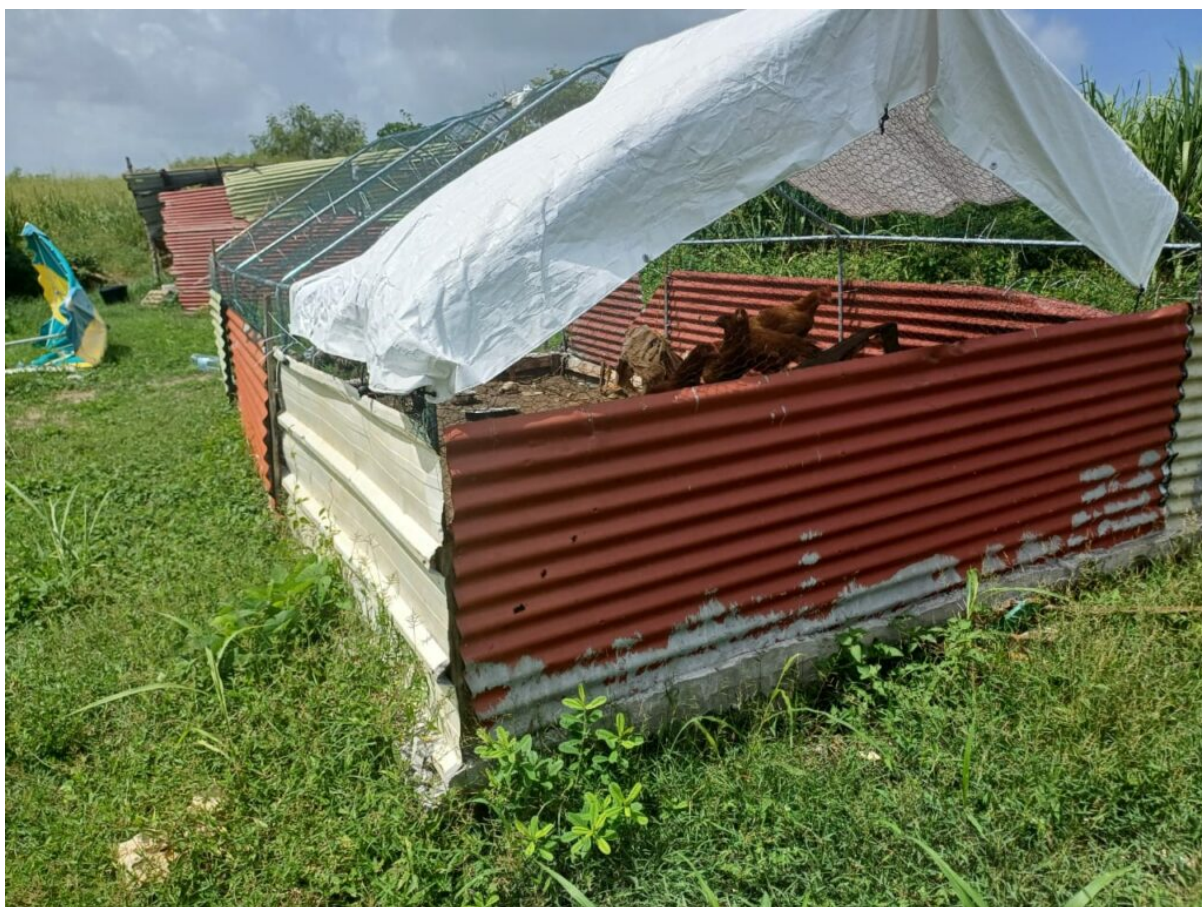
25 octobre 2024. La parcelle AE 553 au Moule est occupée sans titre par