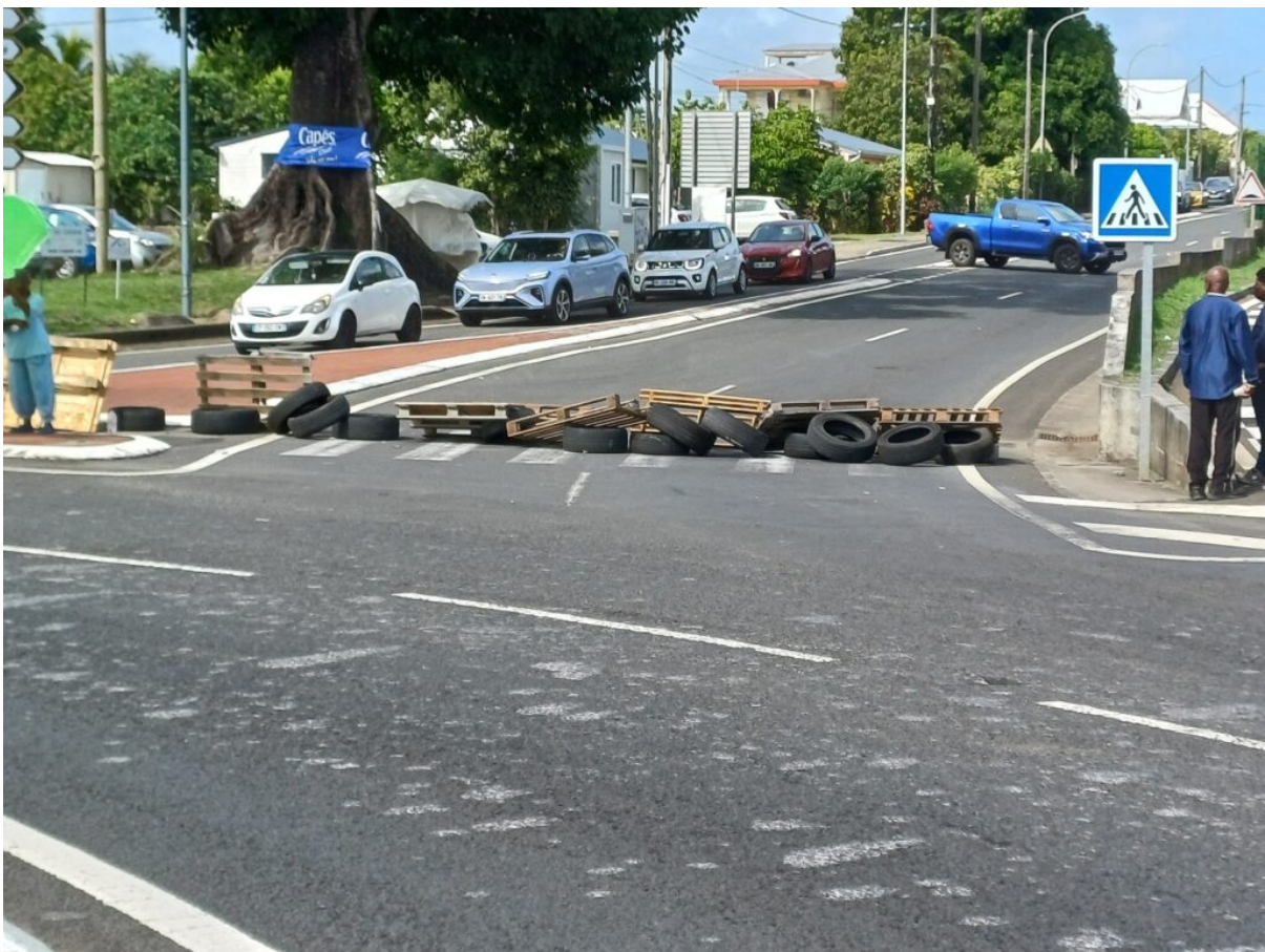
Le 14 octobre le collectif LCDM bloque le rond-point de Jabrun à Baie-Mahault.