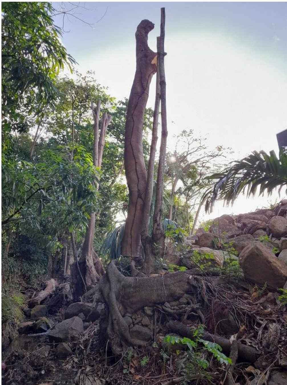
Élagage au bord de la ravine Espérance à Basse-Terre. Mars 2025.