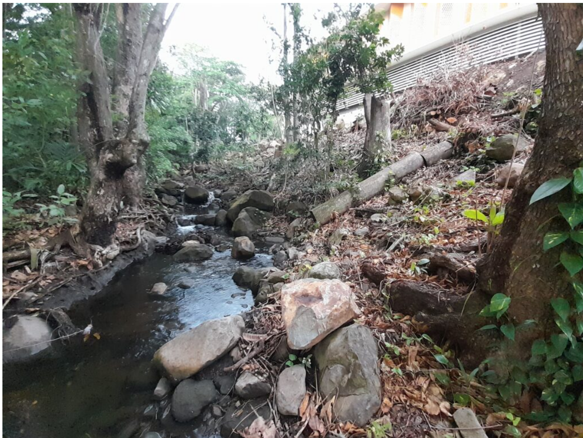
Élagage au bord de la ravine Espérance à Basse-Terre. Mars 2025.